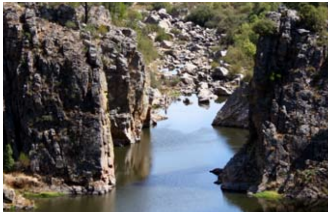
vista sobre as Portas do Almourão

Azeite Broas de Mel Cabrito à moda da Aldeia Peixe do Rio Tigelada no Forno